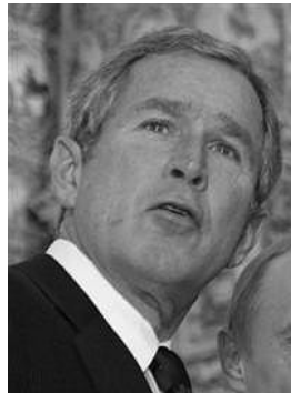
George Walker Bush.

El canciller iraquí, Hoshiyar Zebari dijo que los iraquíes “comprenden la inmensa presión que se incrementará más y más en Estados Unidos” antes que el embajador de ese país y el principal comandante de las fuerzas apostadas en Irak presenten en septiembre un informe ante el Congreso norteamericano. “Hemos hablado con miembros del Congreso y les hemos explicado sobre los peligros de una pronta retirada (de Irak) y de dejar un vacío de poder”, manifestó Zebari. “Los peligros podrían ser