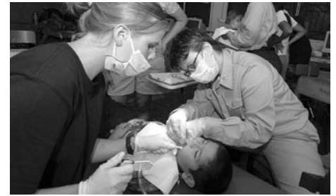
Más de 5 mil nicas fueron atendidos por médicos especialistas del COMFORT.

El vicemandatario fue claro al decir que no “simpatiza” con ningún tipo de reelección, aunque afirmó que esta táctica ha sido beneficiosa para otras naciones. En otro orden, el vicepresidente, Jaime Morales Carazo, opinó con respecto a la guerra diplomática de China Continental y Taiwán, para conquistar Nicaragua, que si de el fuera la elección de relación diplomática, prefiere sostenerla con la pequeña isla taiwanesa, porque con esta nación, se tiene más experiencia diplomática, comercial y de cooperación.