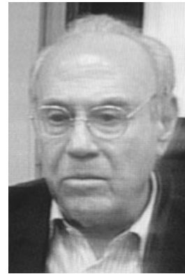
Vicepresidente de la República, Jaime Morales Carazo

El segundo representante de la nación dijo que en otros países este tipo de agrupaciones ciudadanos, han tenido bastante éxito para el desarrollo de otros países, sin embargo, hay procesos difíciles por el cual se debe pasar, concluyó Morales.